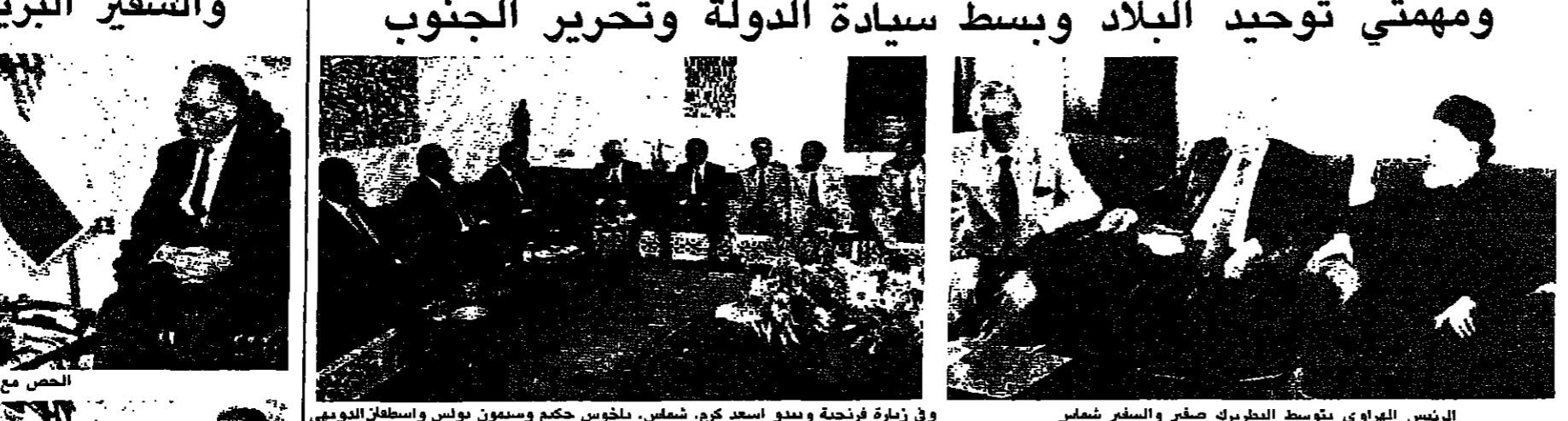
الرئيس الهراوي يتوسط الطيريك صفر والسفير الفرنسي الدكتور سيمون بولس واسطفان النويهي

وقد حضر اللقاء وزير الخارجية الفرنسي جاك شيراك، والسفير الفرنسي في بيروت، والسفير اللبناني في باريس، والسفير الهراوي في باريس، والسفير الهراوي في بيروت، والسفير الهراوي في بيروت.